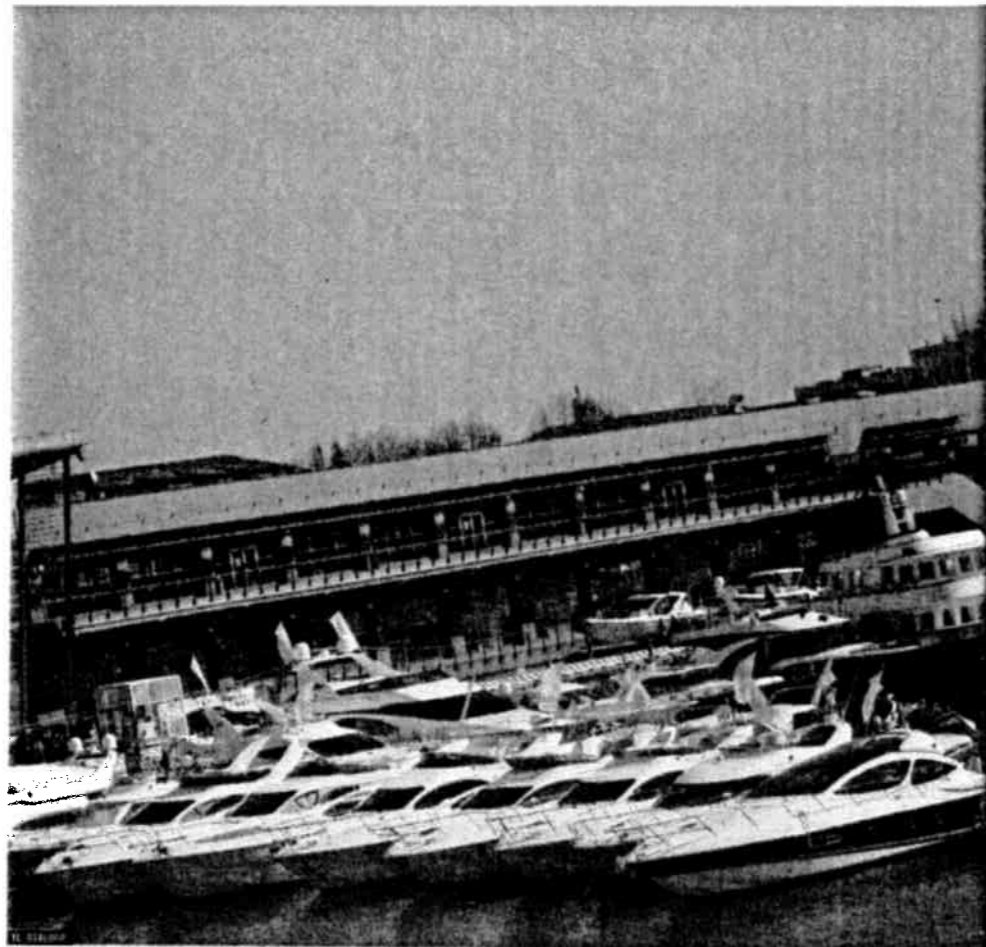
In Marittima. Un'immagine delle barche in esposizione al Salone di Venezia

Città di Chioggia COMUNE DI CHIOGGIA Corso del Popolo, 1193 30015 Chioggia (VE) Tel. 041/5534811